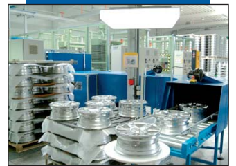
Wasch- und Trockenstraße