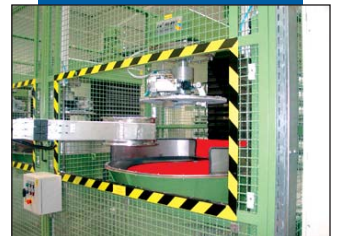
Arbeiten mit modernster Technik

wieder zurück. Kosten für den Rückversand 9,- Euro pro Felge oder aber man geht zu einem der zahlreichen angeschlossenen Filialen, darunter auch alle SKN-Tuning Filialen. Eine Liste hierfür gibt es im Internet. Vorteil bei den Filialen ist dann auf jedenfall der Service und die Beratung. Man kann sich dort auch direkt anschauen, wie das Ergebnis aussehen wird. Alles in allem eine sehr interessante Alternative zum teuren Neukauf!